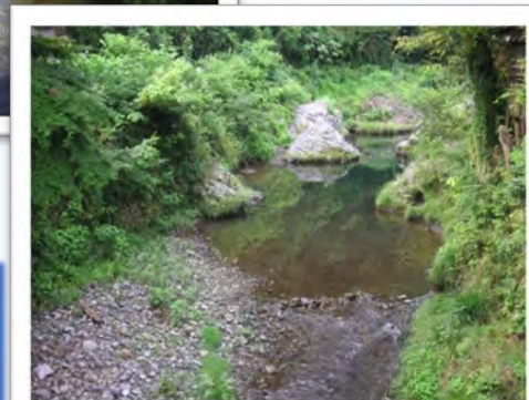
両界橋から上流側