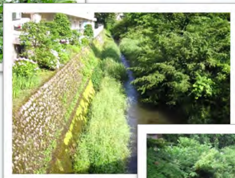
蛇滝橋から上流側